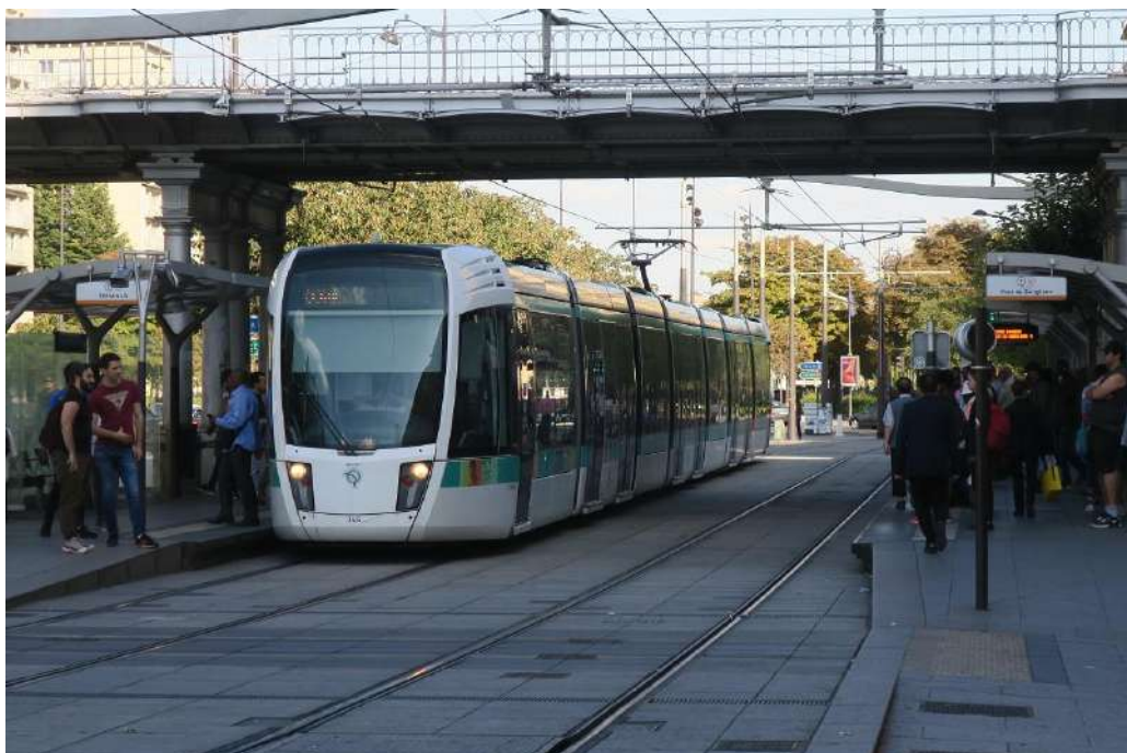
Tram alla Porte de Vincennes

https://it.wikipedia.org/wiki/Rete_tranviaria_dell'Île-de-France