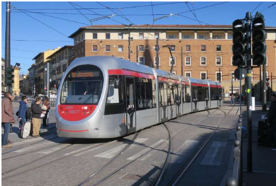
Tram fiorentino in zona stazione

http://mobilita.comune.fi.it/tramvia/sistema_tramviario/sistema.html